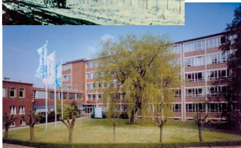
Die Hauptverwaltung von Krantz Anlagenbau heute