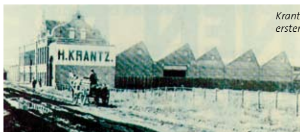
Krantz-Gründungshaus mit erster Fertigung in Aachen